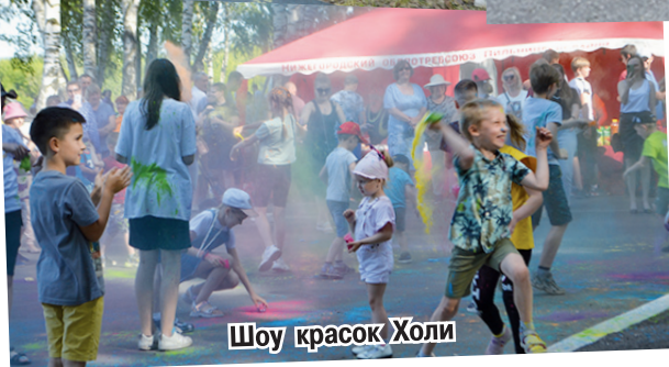
Шоу красок Холи