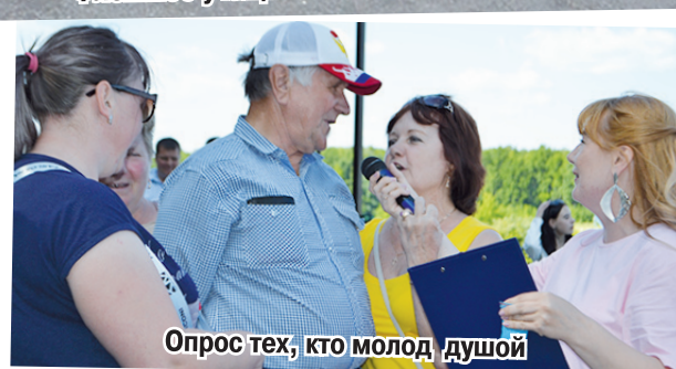
Опрос тех, кто молод душой