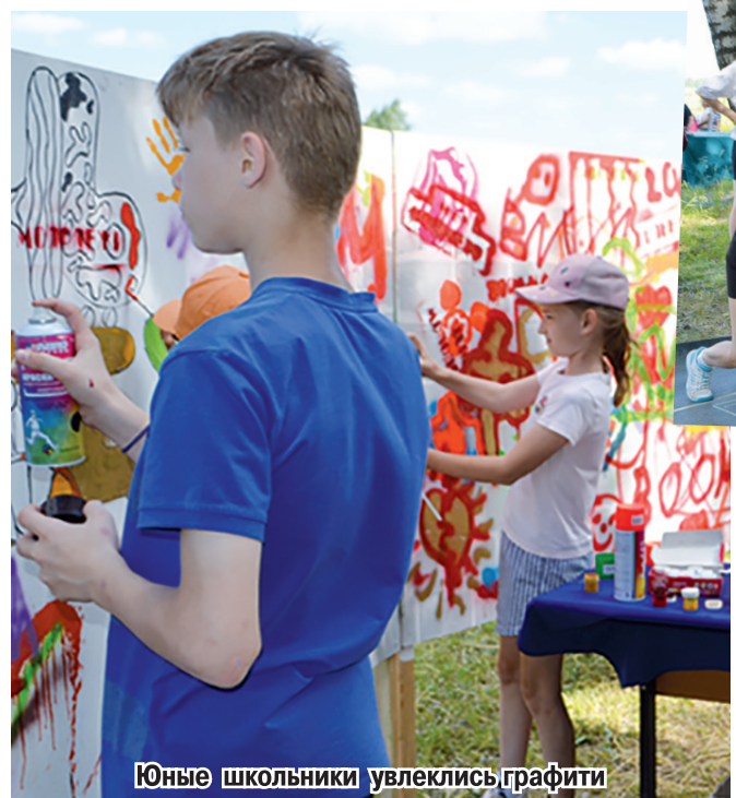
Юные школьники увлеклись граффити