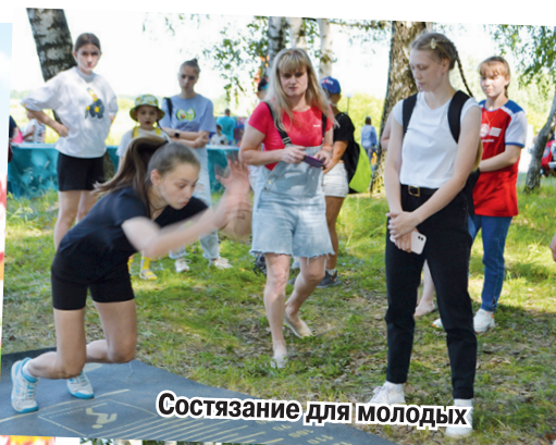
Состязание для молодых