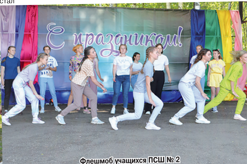
Флешмоб учащихся ПСШ № 2